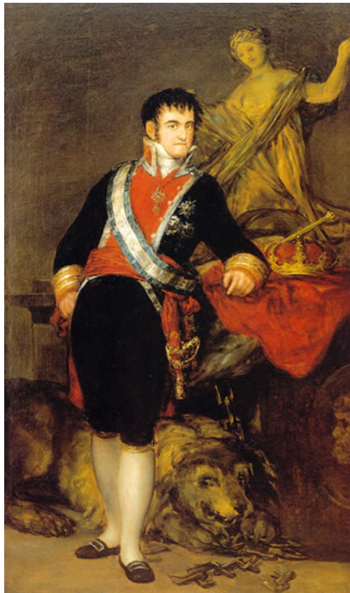
Fernando de Borbón y Parma Fernando VII rey de España (San Lorenzo de El Escorial, Madrid, 14 de octubre de 1784 - Madrid, 29 de septiembre de 1833). AUTOR:FRANCISCO DE GOYA