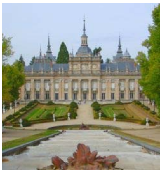
PALACIO DE LA GRANJA

El Palacio Real de la Granja de San Ildefonso es una de las residencias de la Familia Real Española y se halla situado en la localidad segoviana de San Ildefonso . Está gestionado por Patrimonio Nacional y abierto al público.